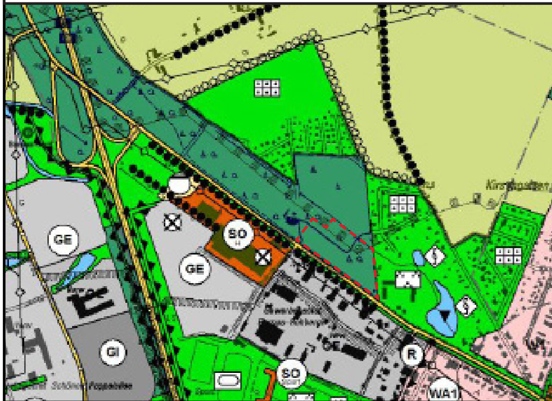
Geplante Darstellung der 26. Änderung des Flächennutzungsplans (Vorentwurf 07/2024)